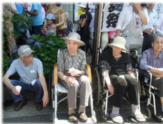
地域の行事へも参加します