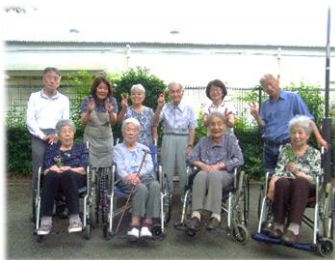
天気の良い日はお散歩へお出かけ