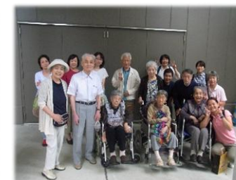
ららぽーと行きました