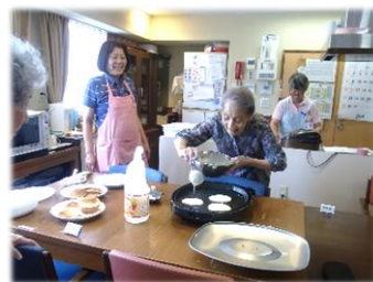
お菓子作りも手伝います!