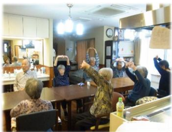
毎日の体操で、健康維持!