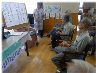
元気な声で音楽療法!