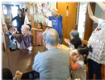
保育園の子供たちとの交流!