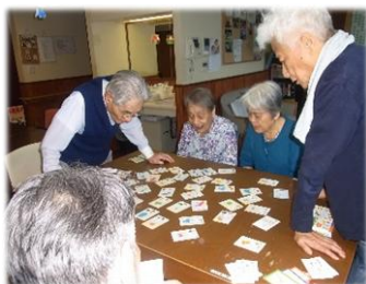
かるたをする時の目つきは本気で!